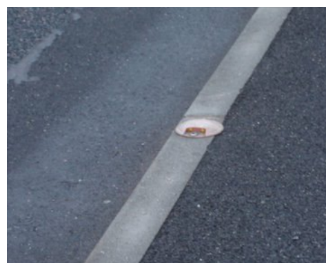
Illustration 2: Exemple de réflecteur lumineux