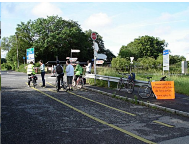
Rencontre et échange d'informations avec les cyclistes transfrontaliers