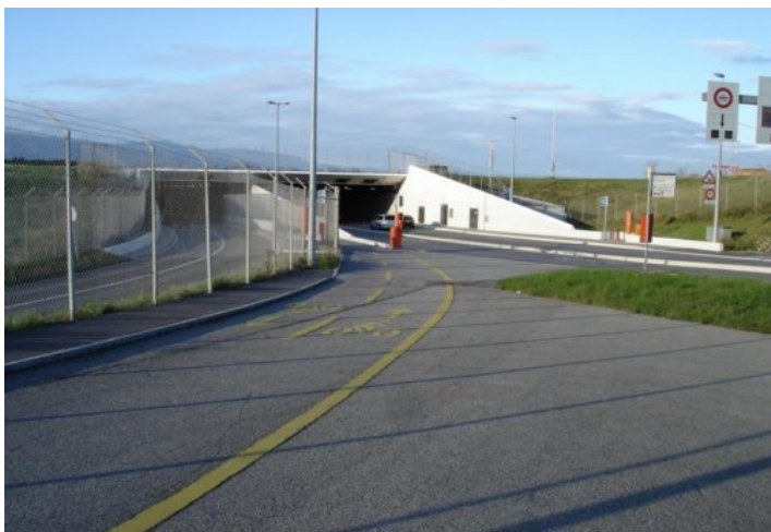
Le comptage a été effectué à la sortie du tunnel de Ferney-Voltaire

Le poste de comptage était installé à la sortie du tunnel passant sous la piste de l'aéroport de Genève, dans le sens Ferney-Genève. Cet emplacement permettait d'identifier tous les cyclistes passant par la douane de Ferney en direction de Genève. Un observateur, membre du bureau de l'APiCy, était en charge de noter l'heure de passage de chaque cycliste, ainsi que son sexe. Il notait également si le cycliste portait un casque. Les autres membres du bureau de l'APiCy étaient situés environ 100 mètres plus loin, au niveau d'un stop obligeant la plupart des cyclistes à s'arrêter, afin de discuter avec ceux qui étaient disponibles, et de recueillir le témoignage de leur expérience de cycliste transfrontalier. Cet entretien avec les cyclistes était non structuré. Il permettait également de donner des informations sur l'APiCy et ses activités.