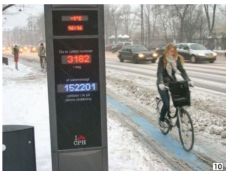
Exemple d'un compteur de vélos affichant le nombre de cyclistes étant passé dans le journée et depuis le début de l'année. La société français Eco-compteur est un des leader mondiaux dans ce domaine.

Enfin, l'APiCy réitère les demandes déjà formulées auprès des autorités que soient rapidement mis en place dans le Pays de Gex des aménagements cyclables sur les grands axes de déplacement, à l'instar de et en correspondance avec les pénétrantes cyclables en cours de réalisation dans le canton de Genève [3].